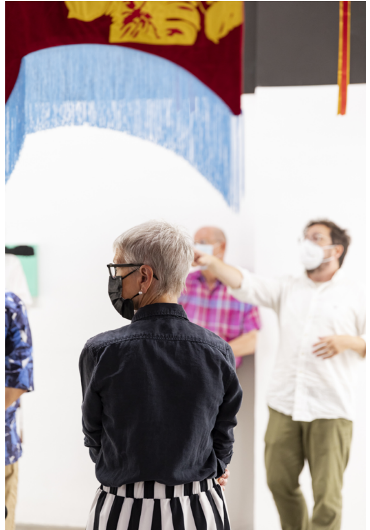
ADN Galeria. Visita guiada a la exposición It's Time to Go Back to Street , de Marinella Senatore.