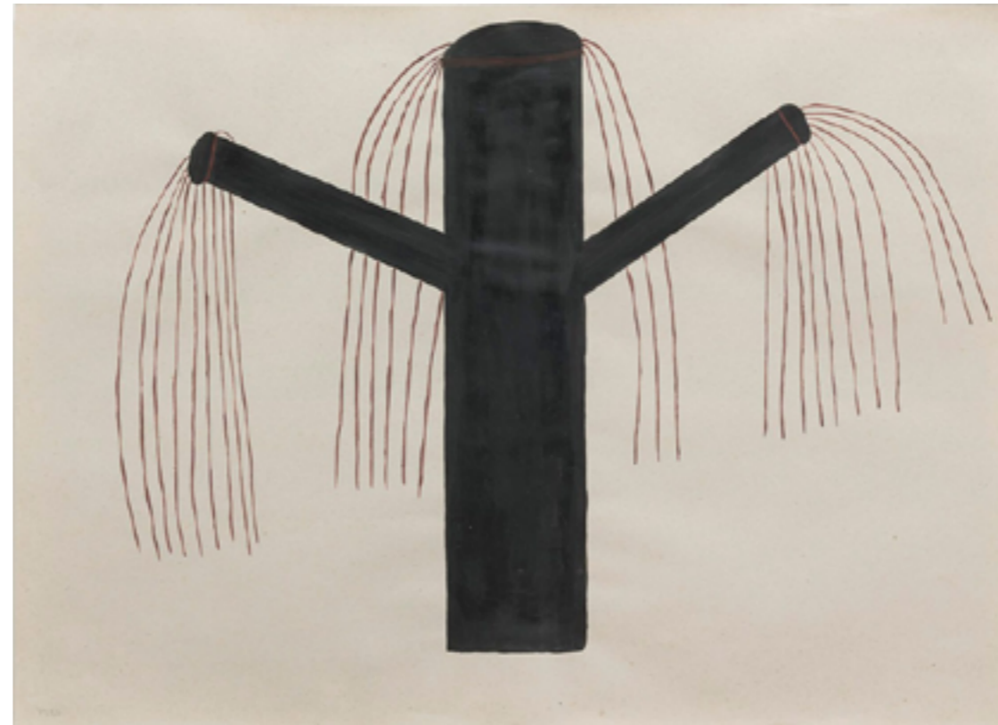
PIRAMIDÓN, CENTRE D'ART CONTEMPORANI Galería Ana Mas Projects Sheroanawe Hakihiiwe: Masi | Especie de palma de frutos duros, 2019 Acrílico sobre papel de caña estucado 50 x 70 cm