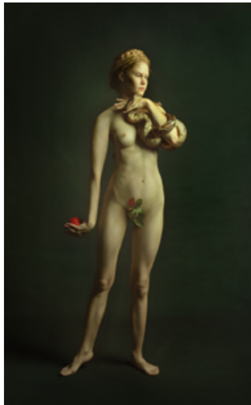
FUNDACIÓ VILA CASAS Galería Valid Foto Alisa Sibirskaya: Adán y Eva, 2019 (Serie Génesis) Impresión en Chromaluxe, Ed. 1 / 3 120 x 80 cm

Las tres entidades han elegido libremente las obras, sin limitación de valor y en relación directa con las galerías.